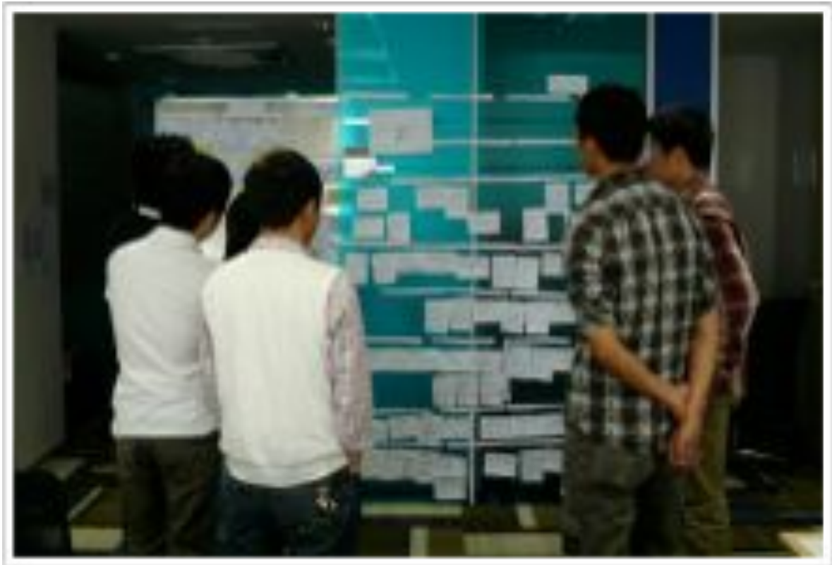
Abbildung 5: Visuelles Management - Sprint Backlog Aufgaben an der Wand

sein Ziel sich nicht ändern wird, was seinen Fokus darauf verstärkt, die Vervollständigung sicherzustellen. Zweitens wird der Product Owner diszipliniert, die Einträge, die er priorisiert und dem Team für den Sprint anbietet, wirklich zu durchdenken.