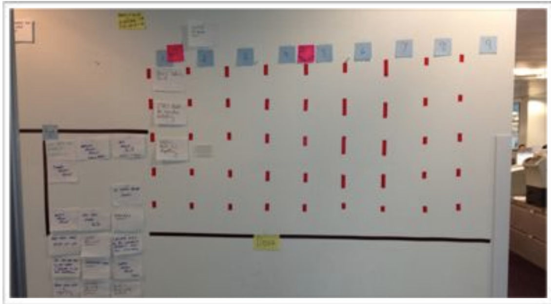
Abbildung 3. Visuelles Management: Product Backlog Items an der Wand

Das Product Backlog beinhaltet eine Vielzahl von Items , hauptsächlich neue Kunden-Features („ermögliche es allen Benutzern, ein Buch in den Einkaufswagen zu legen“), aber auch größere technische Verbesserungs-Ziele (z.B. „portiere das System von C++ auf Java“), Verbesserungen (z.B. „beschleunige unsere Tests“), Forschung und Recherche („untersuche Lösungen für die schnellere Kreditkartenvalidierung“), und möglicherweise bekannte Defekte („diagnostiziere und behebe die Fehler im Skript für die Bestellverarbeitung“), wenn es davon nur eine kleine Anzahl gibt. (Ein System mit vielen Defekten hat häufig ein separates Bug-Tracking.)