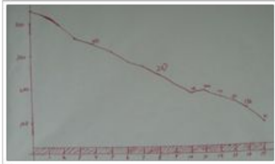
Abbildung 8. Visuelles Management: Handgezeichnetes Sprint Burndown Chart

Auch wenn die Sprint Burndown Kurve als Kalkulationstabelle erzeugt und dargestellt werden kann, finden viele Teams es effektiver, sie auf Papier an einer Wand in ihrem Arbeitsraum zu zeigen, mit handgeschriebenen Änderungen. Diese „low tech/high touch“ Lösung ist schnell, einfach, und oft sichtbarer als eine Computer-Graphik.